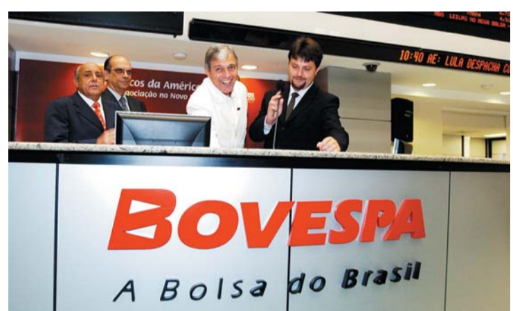
Solenidade do início das negociações com os papéis da DASA

O mercado disputou avidamente as estreantes, principalmente porque todas ingressaram no Novo Mercado ou no Nível 2 da Bovespa, que zelam pelas boas práticas de governança corporativa. Analistas setoriais e estrategistas-chefes de instituições financeiras concordam que essa é uma tendência irreversível. Por essa visão, não há mais hipótese de uma abertura de capital se dar em um ambiente que pouco reconhecia os direitos dos minoritários.