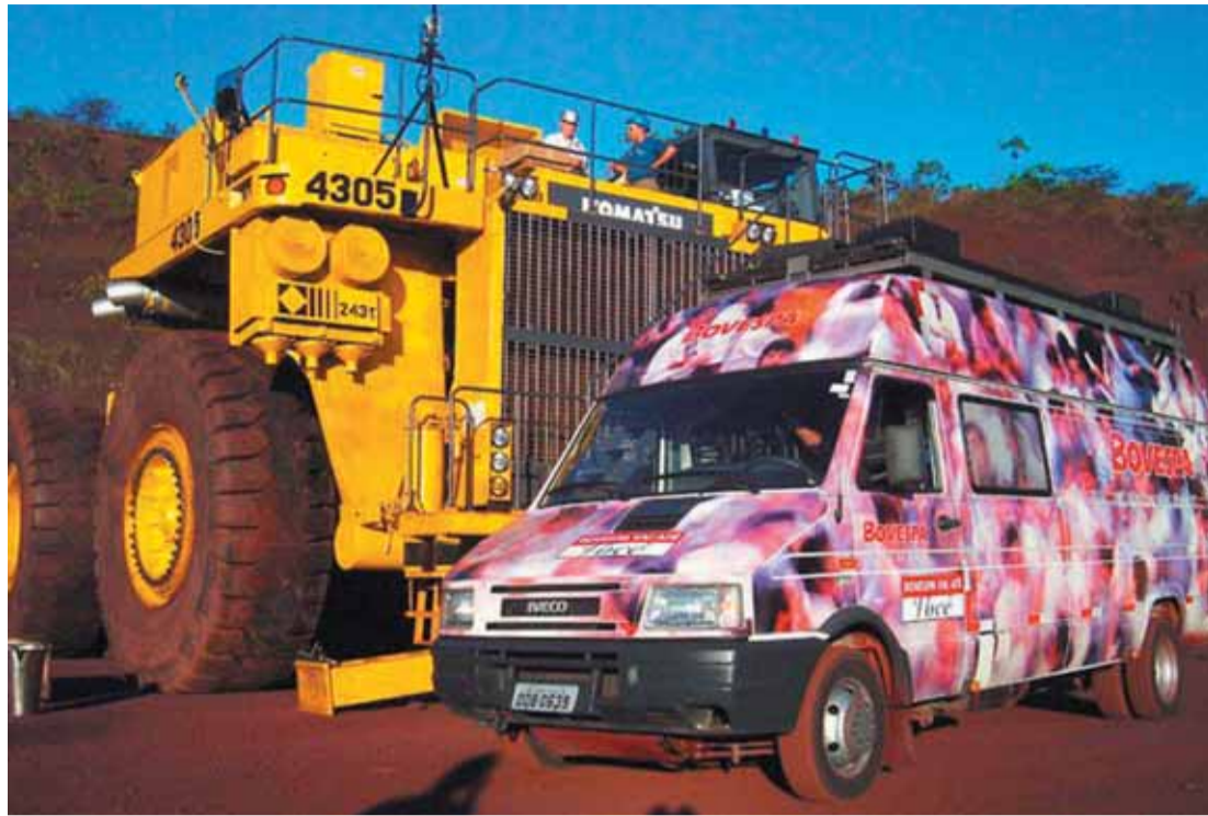
Programa Bovespa vai até Você em Carajás, na apresentação a funcionários da Vale do Rio Doce

Um apelo quase irresistível é o programa Bolsa Aberta, criado para permitir a visitação pública da Bovespa nos fins de semana. Localizada no centro histórico de São Paulo, a Bovespa transforma o pregão em um espaço expositivo, onde os interessados ou curiosos podem conhecer de perto a importância do mercado de ações no desenvolvimento do