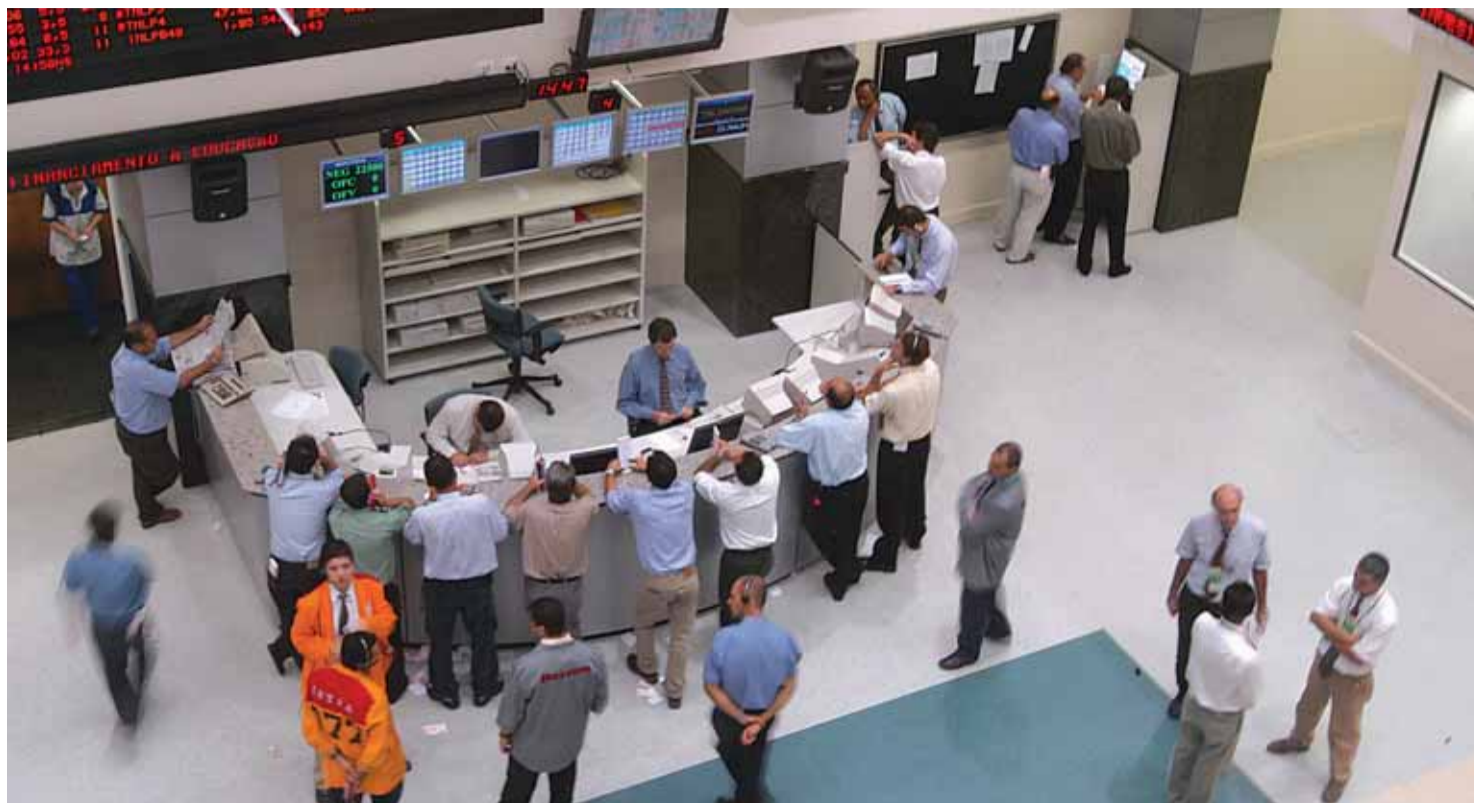
Operadores no pregão da Bovespa: ações sob os efeitos da economia

Expectativas de desempenhos setoriais também afetam as ações.