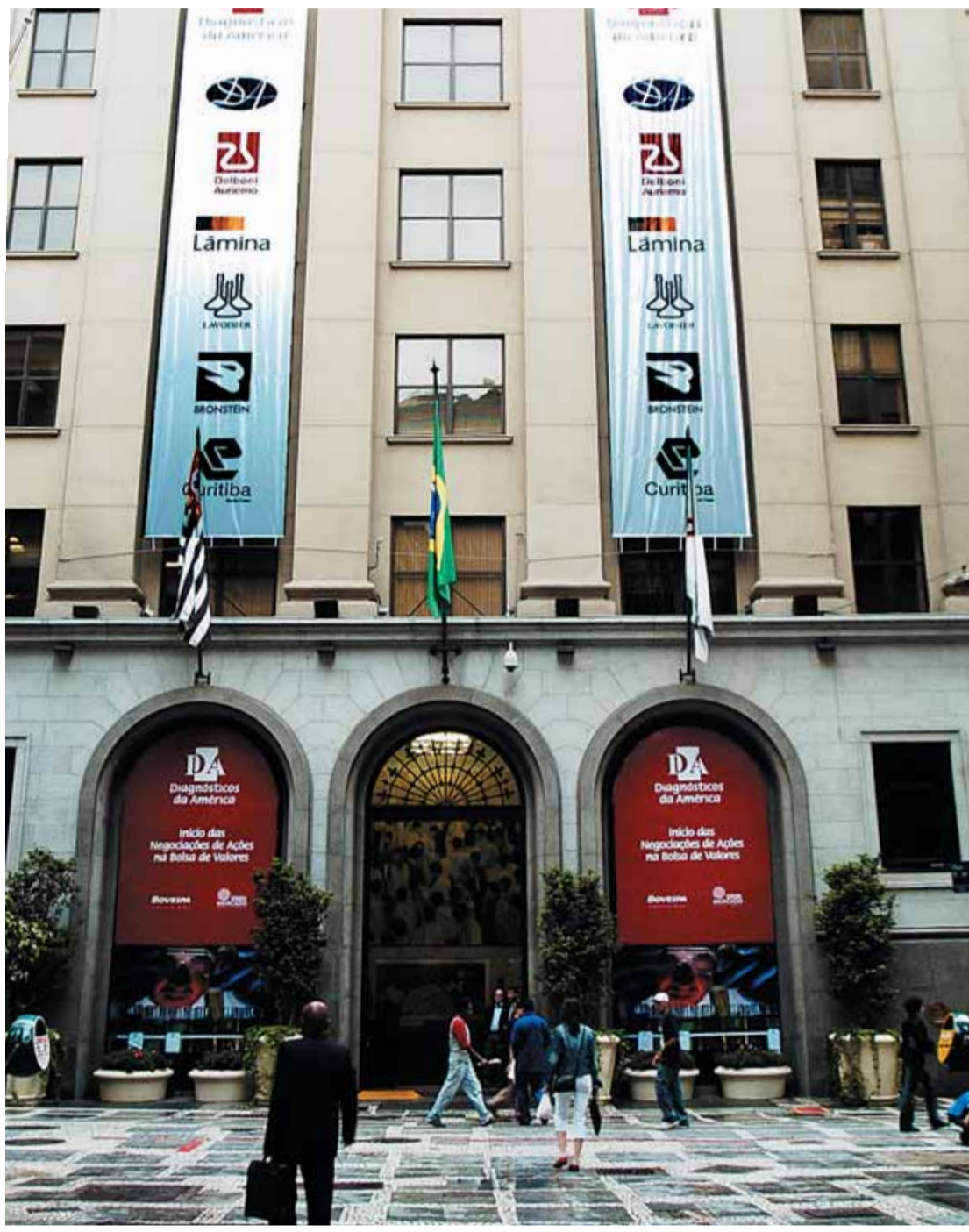
Entrada da Bolsa de Valores de São Paulo: novas empresas listadas e maior volume de negócios

O amadurecimento dos investidores brasileiros abriu uma porta extraordinária para o desenvolvimento do mercado de capitais no país. A Bolsa de Valores de São Paulo ganhou o respeito de investidores estrangeiros, pessoas físicas, fundos de pensão e as tradicionais tesourarias que, apesar do nível ainda elevado da taxa básica de juros, vêm na diversificação de aplicações a receita ideal para maximizar ganhos.